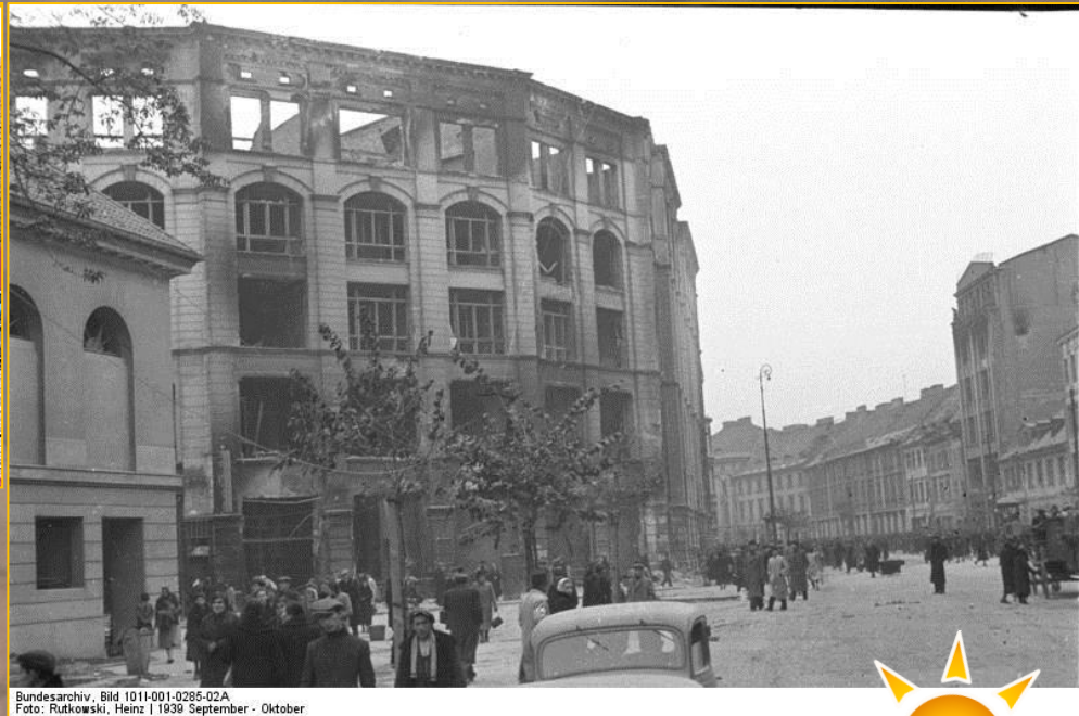
1939 September - Oktober

Na archiwalnym zdjęciu z 1939 r część budynku handlowo – usługowego - Pasażu Simonsa, który po wojnie nie został odbudowany.